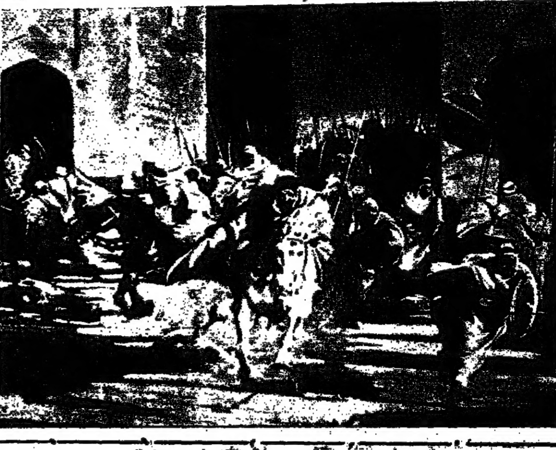
هكذا امتلأوا القتل عملاً وأن قتلوا مع الروم . فغضب الروم بجزية مخزونة بالهبة

اكتشاف مهم في سوريا . اكتشف ملكة أورغارت عاصمة